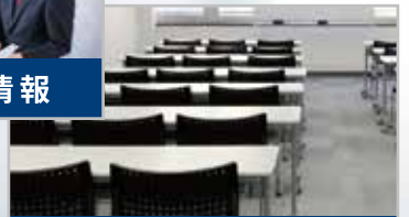
採用イベント情報