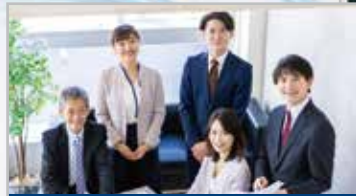
積極採用企業情報